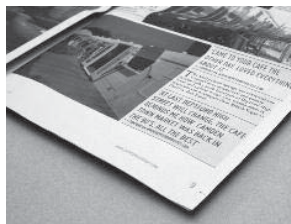
Journal : ....