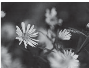
Fleurs : ....