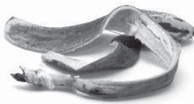
Épluchure : ....