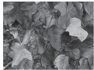
Feuilles d'arbre : ....