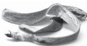
Peau de banane