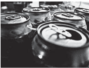
Canette : ....