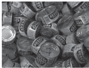
Conserves : ....