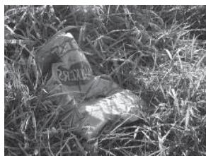
Paquet de chips